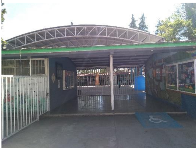
Figura: esc. Prim. Valentín Gómez Farías T.V