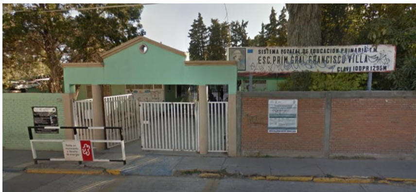
Fig. Fachada escuela Valentín Gómez Farías