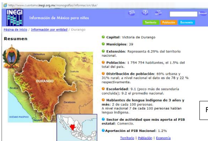
Figura: fuente INEGI.

Según los datos que arrojó la encuesta realizada por el Instituto Nacional de Estadística y Geografía (INEGI) con fecha censal del 15 de marzo de 2015, el estado de Durango contaba hasta ese año con un total de 1,754,754 habitantes. De dicha cantidad, 860,382 eran hombres y 894,372 eran mujeres. 1 La tasa de crecimiento anual para la entidad durante el período 2010-2015 fue del 1.6% su población absoluta es de 1,754,754 y su población relativa es de 14 personas cada km.