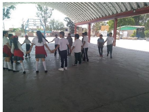
Imagen .- Alumnos de 5to. Grado de la escuela primaria “Valentín Gómez Farías” T.V.